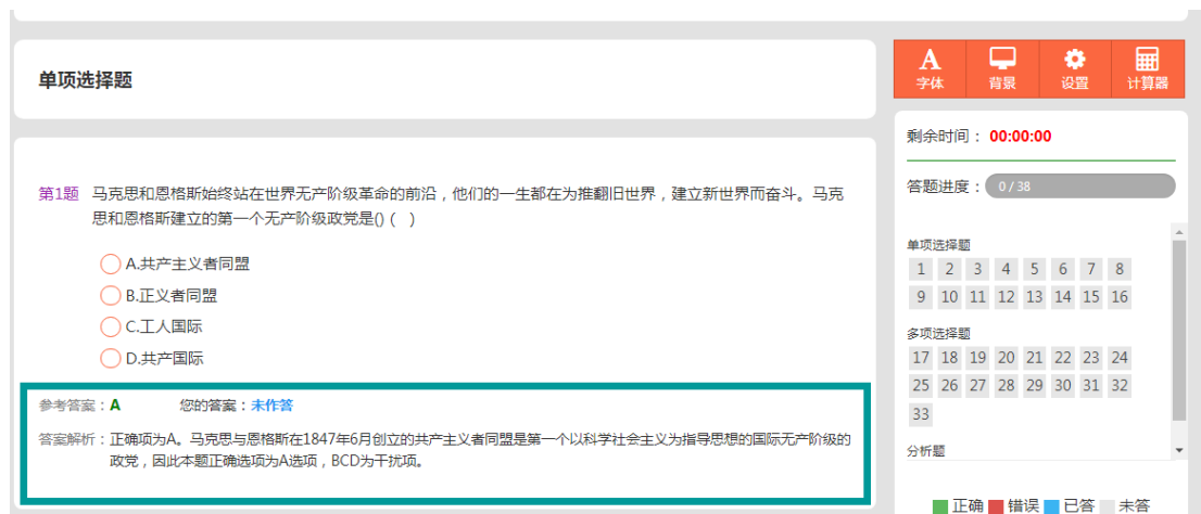
(图 8) 详细解答、成绩分析