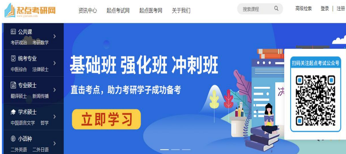
(图 1) 《起点考研网》主页