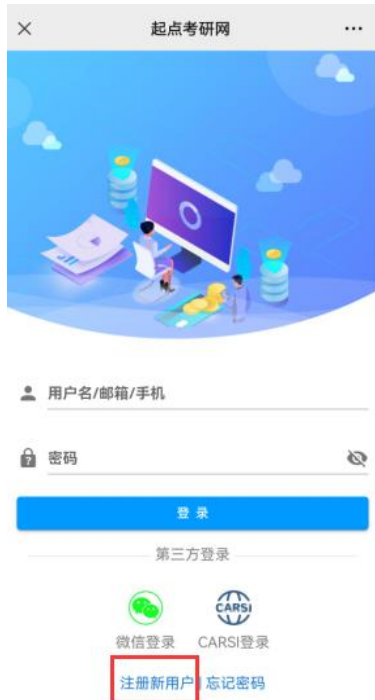
首次登陆校园网内注册